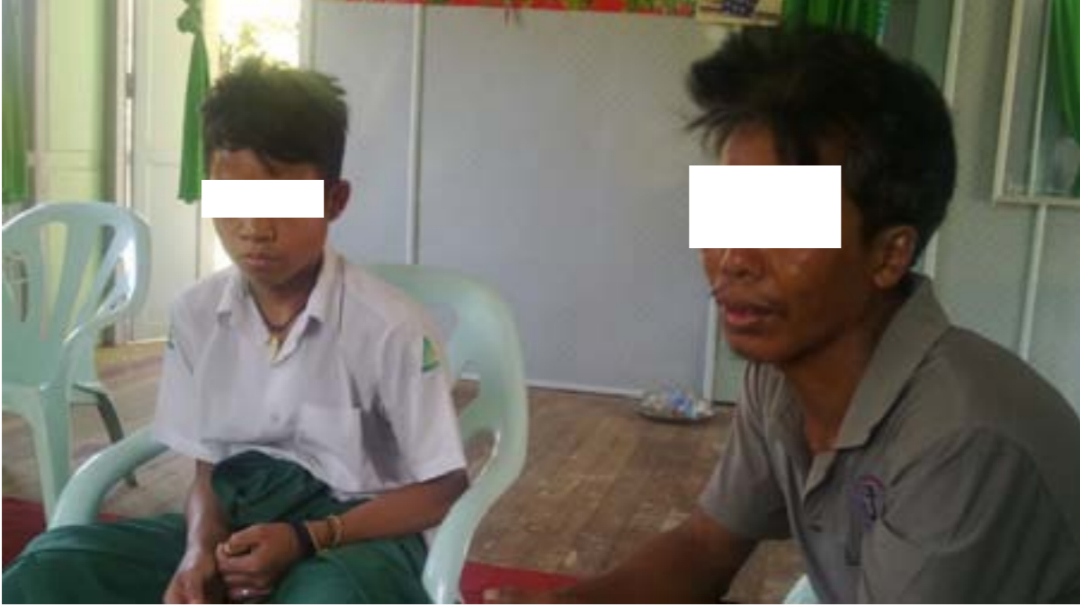
ပုံ (၁၁) - ချိုးဖောက်ခံရသောမောင်***နှင့် ဖခင်ဦး***တို့မှအမှုဖြစ်စဉ်ကိုပြန်လည်ပြောပြနေစဉ်