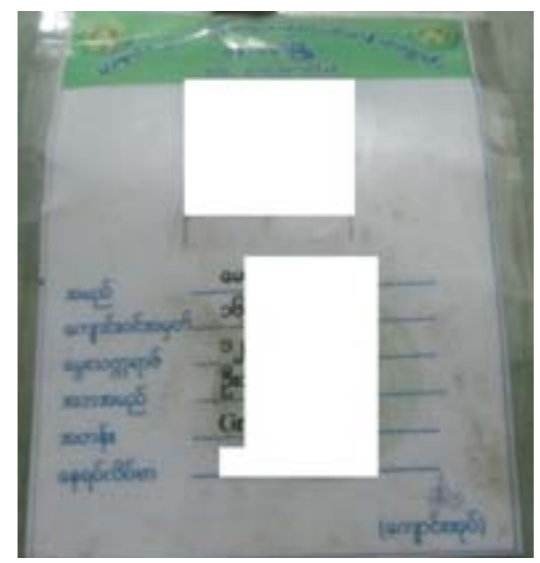
ပုံ (၉) - ချိုးဖောက်ခံရသူမောင်****၏ ကျောင်းသားကတ်