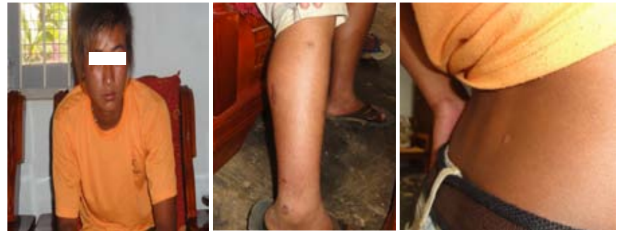
ပုံ (၂၁) - ချိုးဖောက်ခံရသူမောင်***၏ ပုံ ပုံ (၂၂) (၂၃) - ချိုးဖောက်ခံရသူမောင်***၏ ဒဏ်ရာများ