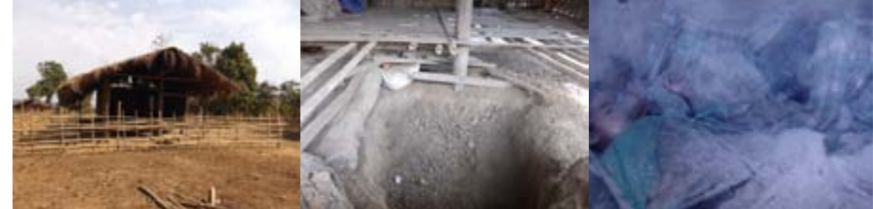
ပုံ (၁၃) - အခင်းဖြစ်ပွားသည့် နေအိမ် ပုံ (၁၄) - လက်နက်ကြီးကျသည့်နေရာ ပုံ (၁၅) - သေဆုံးသူ ဒေါ်ဘောက်တောင်နှင့် ဘရန်ဆန့်