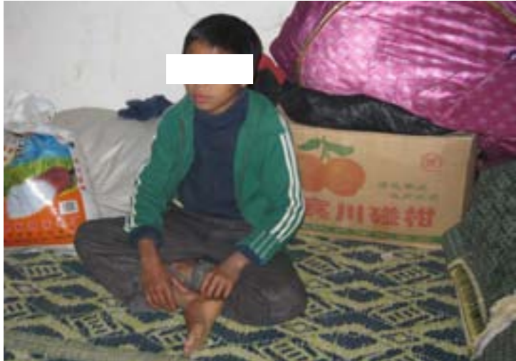
ပုံ (၆) - ချိုးဖောက်ခံရသူဒေါ်****၏ သားမောင်****မှဖြစ်စဉ်ကိုပြန်လည်ပြောပြနေစဉ်