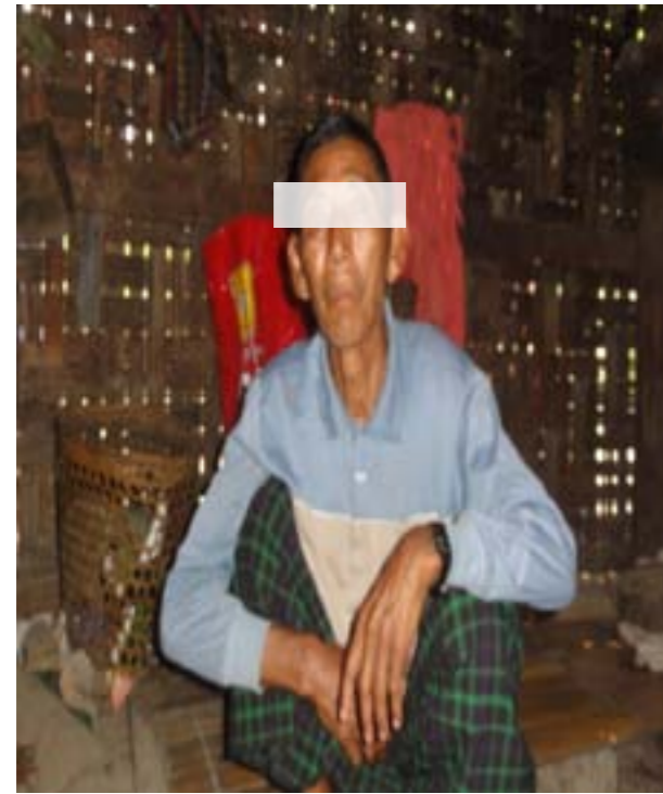
ပုံ (၁) - ချိုးဖောက်ခံရသူဦး****