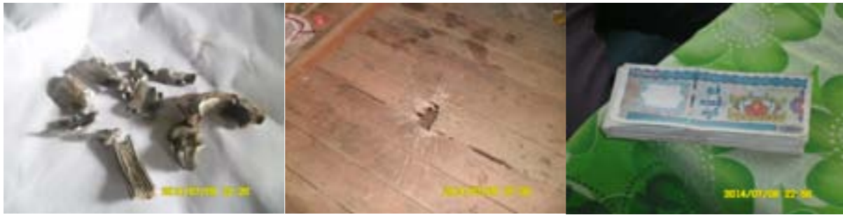
ပုံ (၃) - မိုင်းခေါင် IDP Camp တွင်ကျသော လက်နက်ကြီးအပိုင်းအစ ပုံ (၄) - မိုင်းခေါင် IDP Camp (၂) လက်နက် ကြီးကျသည့် Camp နေအိမ် ပုံ (၅) - အစိုးရစစ်တပ်မှ ပေးအပ်သော ငွေ (၈) သိန်း

ရောက်နေကြတယ်။ (လက်နက်ကျကွဲသောဘေးနားတွင်) အမျိုးသမီး တစ်ယောက် ရပ်နေတယ်။ ဒါပေမဲ့ထိခိုက် မှုမရှိခဲ့ဘူး။”