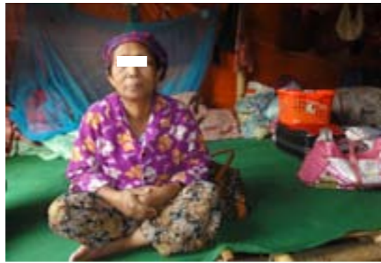
ပုံ (၂၄) - ချိုးဖောက်ခံရသူဒေါ်****