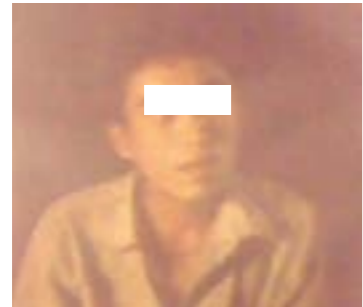
ပုံ (၂၆) - ချိုးဖောက်ခံရသူ ဦး****