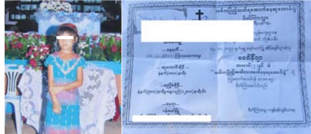
ပုံ (၇) - ချိုးဖောက်ခံရသူမခေါ်နီဂျာ ပုံ (၈) - မခေါ်နီဂျာ၏ တစ်လပြည့် သတိရအောက်မေ့ဆုတောင်းပွဲဖိတ်ကြားလွှာ