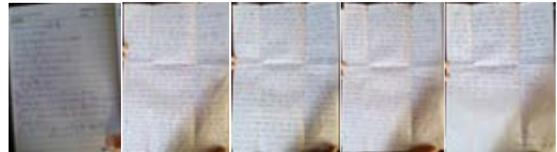
ပုံ (၁၇) - ချိုးဖောက်ခံရသူ မ**** ရေးသားထားသောစာ