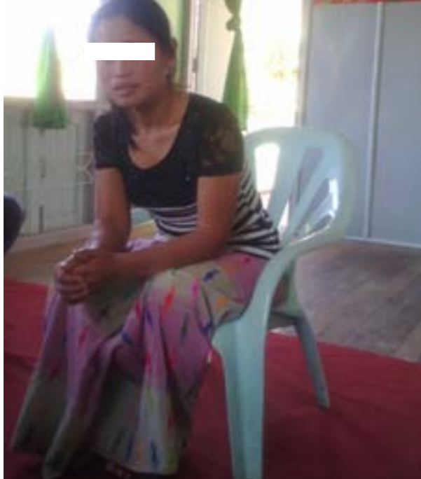
ပုံ (၁၀) - ချိုးဖောက်ခံရသူဒေါ်***မှ အမှုဖြစ်စဉ်ကိုပြန်လည်ပြောပြနေစဉ်