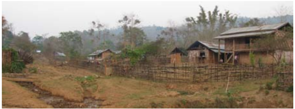
ပုံ (၂၅) - ဘန်ဝါ (ရှမ်းပြည်နယ်) ရွာအဝင်လမ်း