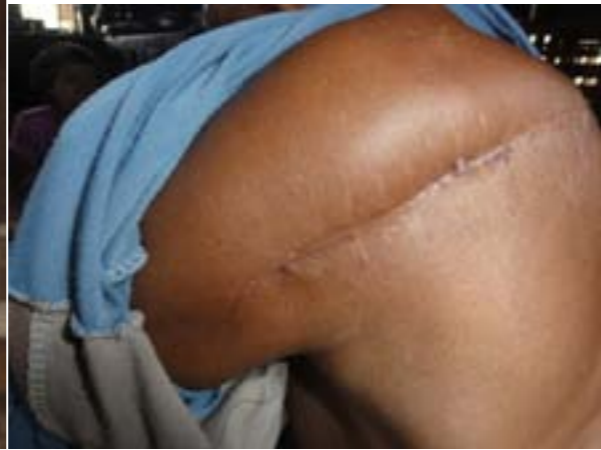
ပုံ (၂) - ဦး****၏ ပခုံးမှဒဏ်ရာ