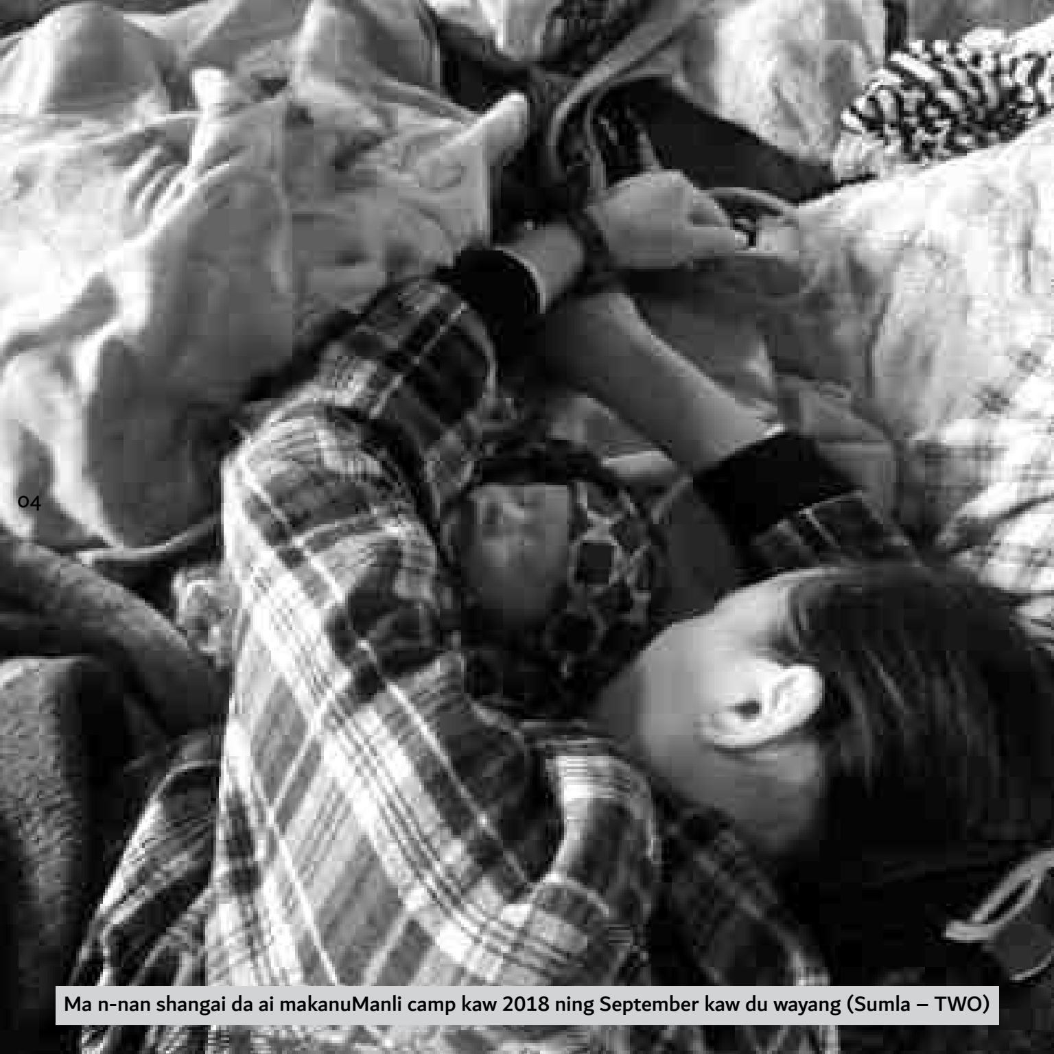
Ma n-nan shangai da ai makanManli camp kaw 2018 ning September kaw du wayang (Sumla – TWO)