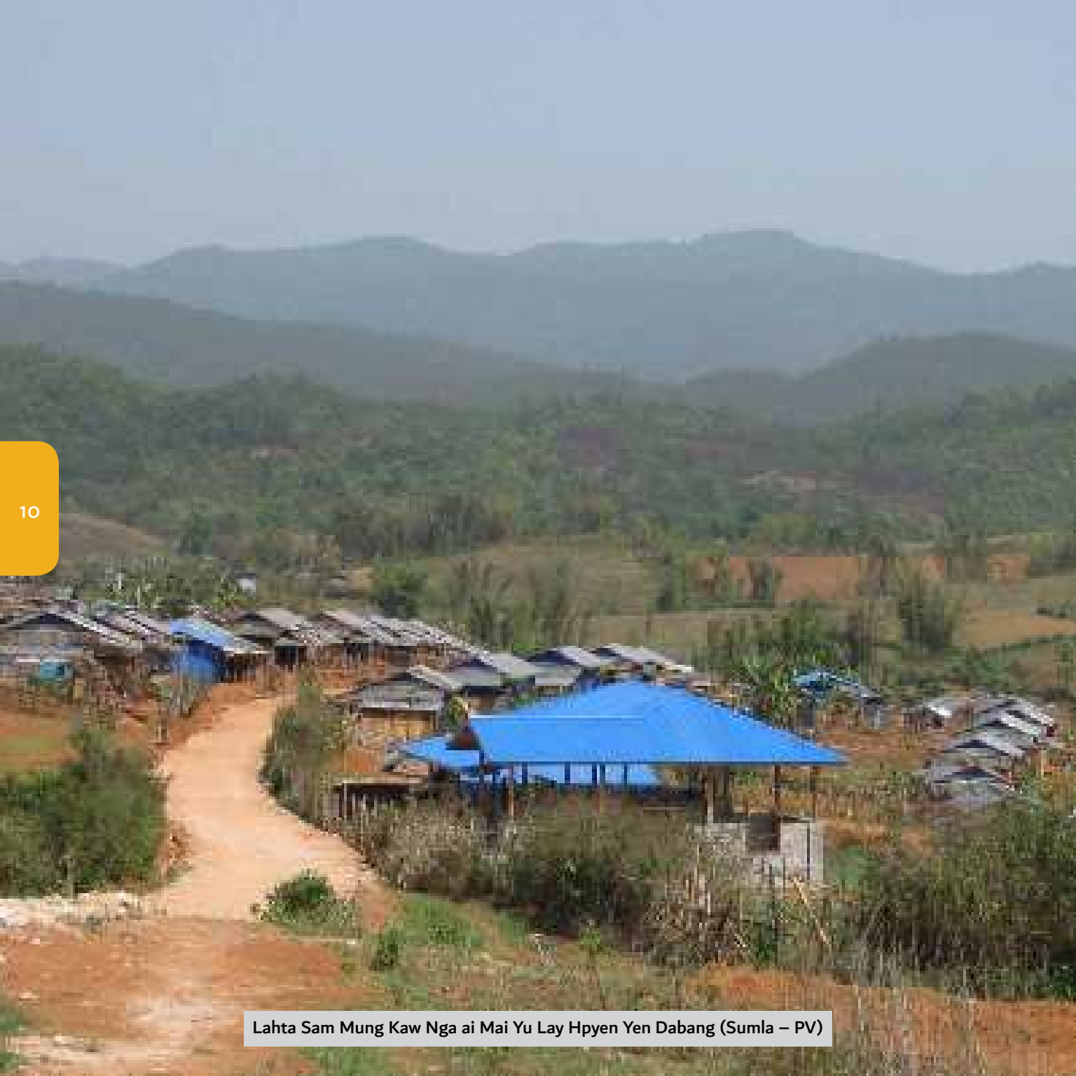
Lahta Sam Mung Kaw Nga ai Mai Yu Lay Hpyen Yen Dabang