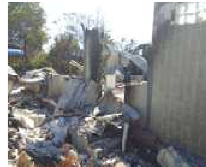
အပေါ်ဆုံးမှ ဓါတ်ပုံ: အမြင့်ပုံဆောက်ထားသည့် မိသားစုအိမ် အောက်ဆုံးမှ ဓါတ်ပုံ: အဆိုပါအိမ်အား စစ်အာဏာရှင်များမှ ဖျက်ဆီးပြီးနောက် တွေ့ရပုံ