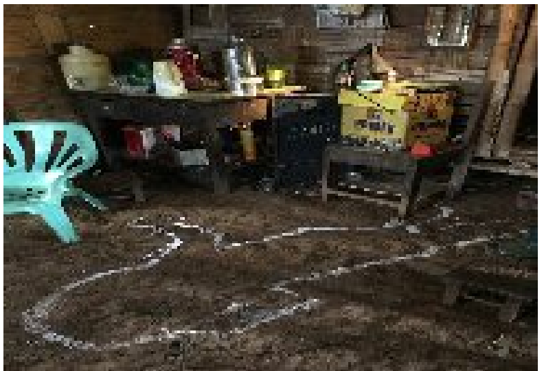
ပန်လောင့် ခန္ဓာကိုယ် လဲကျနေသည့် နေရာ

ထို့နောက် နော်နော်က သူသိထားသည့် ပန်လောင့် ပိုက်ဆံ ထားသော ပိုက်ဆံအိတ်အပါအဝင် နေရာ သုံးနေရာကို ကြည့်သည်။ ပိုက်ဆံများ အားလုံး ပျောက်ဆုံးနေကြောင်း သူမ