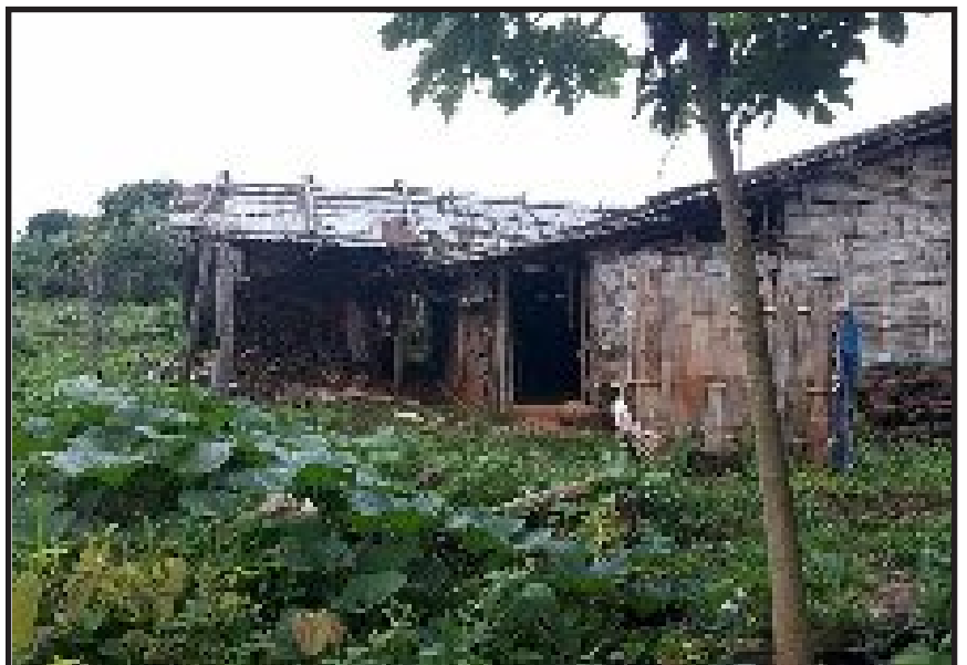
ပန်လောင့် ဈေးဆိုင် အနောက်ဖက်ခြမ်း