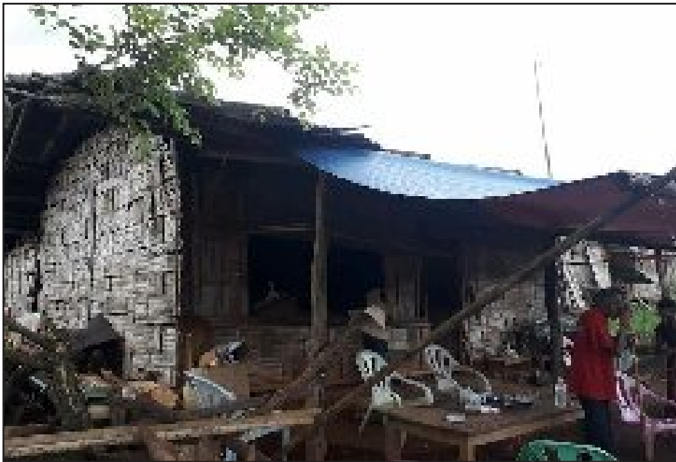
ပန်လောင့် ဈေးဆိုင် အရှေ့ဖက်ခြမ်း