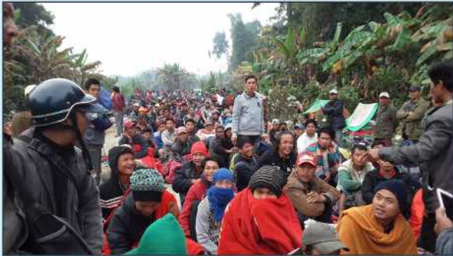
ပယင်းမှော်တွင် ပိတ်မိနေစဉ် လမ်းဖွင့်ဖို့စောင့်နေကြသော ပြည်သူများ

ရွာသားများအား မြန်မာစစ်တပ်မှ ဝဲကြဲတိုက်ခိုက်ပြီးနောက် ရွာသား ၅ ဦး ဒဏ်ရာရရှိသွားသည်။ မိသားစုဝင်အချို့ တစ်နိုင်းရှိ ပယင်းမှော်တွင် သွားရောက် အလုပ်လုပ်စဉ် ကျန်ရစ်သူများက သစ်သားအိမ်အတွင်း နေထိုင်ကြစဉ် တိုက်ခိုက်ခံရခြင်းဖြစ်သည်။ တိုက်ခိုက်ခံရသူများမှာ အသက် ၁၈ နှစ်နှင့် ၃၁ နှစ် ရှိ ညီအမနှစ်ဦး၊ အသက် ၁၈ နှစ် လူငယ်တဦးနှင့် ကလေးနှစ်ဦး တို့ဖြစ်သည်။ ၎င်းတို့မှာ တွေ့ဆုံမေးမြန်းမှု ပြုနေစဉ်အတွင်း ရွာမှ ၄ နာရီခန့်ဝေးသည့် ဆေးခန်းတွင် ဆေးကုသမှု ခံယူနေရသည်။