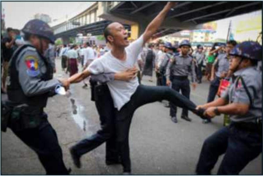
၂၀၁၈ ခုနှစ် မေလ ၁၅ ရက်၊ ဆန္ဒပြသူများအား ရဲတပ်ဖွဲ့မှ ဖမ်းဆီးနေစဉ်

ကချင်ပြည်နယ်တွင် စစ်ဆန့်ကျင်ရေးဆန္ဒပြပွဲများ ဧပြီလကုန်မှ မေလအစပိုင်းအထိ ပြုလုပ်ခဲ့ကြသည်။ စစ်တပ်မှ ကချင်အရပ်သားများအပေါ် လူ့အခွင့်အရေးချိုးဖောက်သည်ဟု ဆန္ဒပြပွဲဦးဆောင်သူများက စွပ်စွဲပြောကြားမှုအပေါ် မြောက်ပိုင်းတိုင်း စစ်ဌာနချုပ်မှ ၎င်းတို့အား အသေရေဖျက်မှုဖြင့် တရားစွဲခဲ့သည်။ နောက်ထပ်ဦးဆောင်သူ ၂ ဦးကိုလည်း ငြိမ်းချမ်းစွာစုဝေးခွင့်ပုဒ်မ ၁၉ ကိုချိုးဖောက်မှုဖြင့် တရားစွဲထားသည်။ ကချင်လူငယ်များ၏ ဆန္ဒပြပွဲများကိုထောက်ခံပြီး ရန်ကုန်တွင် မေလတွင်ပြုလုပ်သည့် ဆန္ဒပြပွဲကိုလည်း ရဲကအကြမ်းဖက်ဖြိုခွင်းပြီးဦးဆောင်သူ ၁၇ ဦးကိုလည်း လူထုတည်ငြိမ်မှုဖျက်ပြားစေရန်နှင့် ခွင့်ပြုချက်မရှိပဲ ဆန္ဒပြမှုနှင့် တရားစွဲခံရသည်။ ၁၀၁