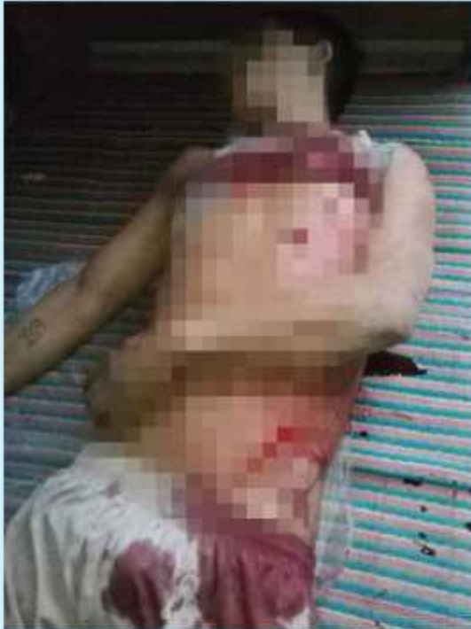
အောင်လွတ်တွင် ဗမာ့တပ်မတော် လေယာဉ်မှ လက်နက်ကြိုးပစ်ချသောကြောင့်သေဆုံးသွားသူ အသက် (၂၀) ရှိ ကချင်တိုင်းရင်းသားတစ်ဦး ခေါ်တံပုံ (KWAT)

တိုက်ပွဲကြားမှ ထွက်ပြေးလာသူ အသက် ၅၇ နှစ်ရှိ ကချင် အမျိုးသားတဦးအား ND-Burma မှ တွေ့ဆုံမေးမြန်းရာ တိုက်လေယာဉ်များသည် သတိပေးမှု တစ်ခုတရားမလုပ်ပဲ ရွာအတွင်းသို့ ဝင်ကြည့်ပြီး သေနတ်ဖြင့်ပစ်ခတ်တိုက်ခိုက်ခဲ့သည်။ ၁၃ ရွာသားများကို ရည်ရွယ်ချက်ရှိရှိ ပစ်မှတ်ထား တိုက်ခိုက်ခြင်းဖြင့် KIA စစ်သားများ ထွက်လာမည်ဟု ၎င်းကပြောသည်။