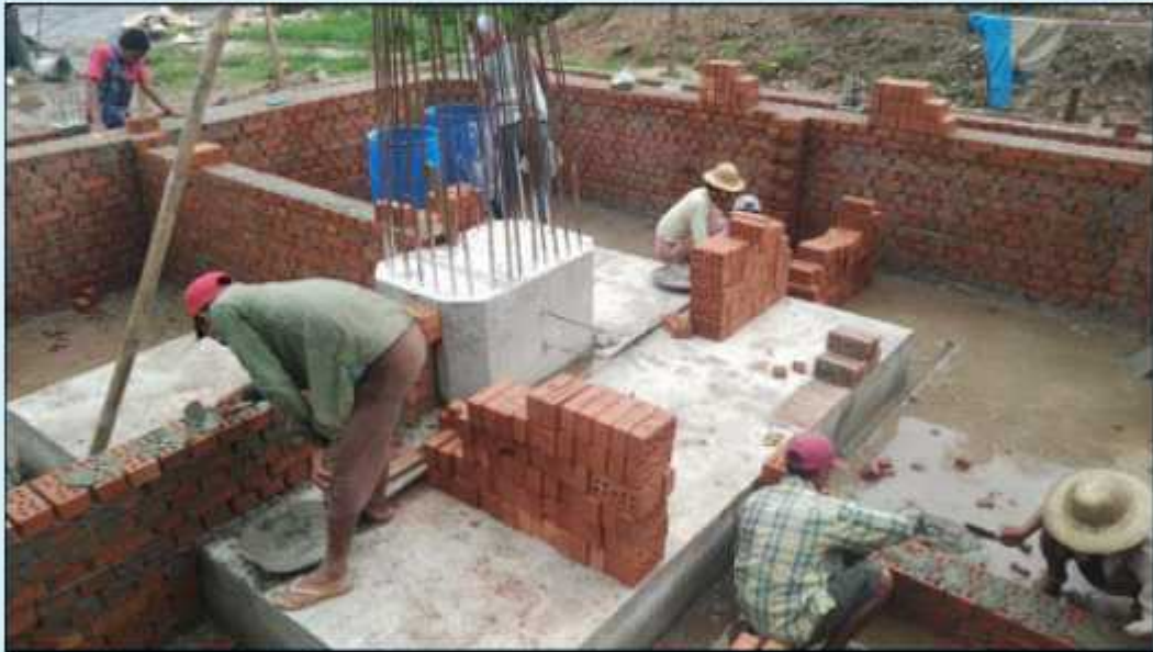
ဓာတ်ပုံ။ ရှစ်လေးလုံးအထိမ်းအမှတ်ကျောက်တိုင် စတင်တည်ဆောက်နေပုံ

အစီရင်ခံသည့်ကာလအတွင်း လူ့အခွင့်အရေးချိုးဖောက်ခံရသူများအတွက် အစိုးရအနေဖြင့် အဓိပ္ပါယ်ပြည့်ဝသည့် ပြန်လည်ကုစားပေးလျော်မှု တစ်စုံတရာဆောင်ရွက်ပေးခြင်းမရှိပေ။ တိုင်းပြည်တွင်းရှိ အရပ်ဖက်အဖွဲ့အစည်းများကသာ (အစိုးရကိုယ်စား) နှစ်နာသူများအား ဆက်လက်ကူညီထောက်ပံ့နေသည်ကို တွေ့ရသည်။ ဖေဖော်ဝါရီလက ရန်ကုန်မြို့တွင် နိုင်ငံရေးအကျဉ်းသားဟောင်းများအတွက် အခမဲ့ကျန်းမာရေး စောင့်ရှောက်မှု ပေးရန် တက်ကြွလှုပ်ရှားသူများနှင့် နိုင်ငံရေးအကျဉ်းသားဟောင်းများက ဖွင့်လှစ်ခဲ့သည်။ အစီရင်ခံစာရေးသားနေသည့်အချိန်တွင် ရှစ်လေးလုံးအထိမ်းအမှတ် ကျောက်တိုင် စိုက်ထူရန်အတွက် ပဲခူးတွင်ဆောင်ရွက်နေသည်။