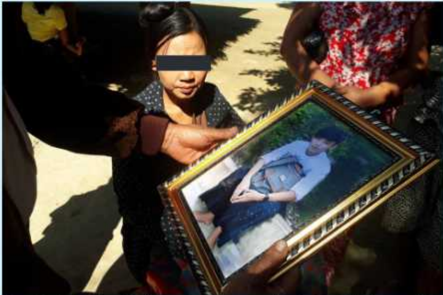
ရဲတပ်ဖွဲ့၏ ပစ်ခတ်မှုကြောင့် သေဆုံးသွားသူ အသက်(၁၈)နှစ်ရှိ တိုင်းရင်းသားတစ်ဦး

ရခိုင်ဘုရင့်နိုင်ငံတော်ကျဆုံးခြင်း အထိမ်းအမှတ် နှစ်ပတ်လည်အခမ်းအနားကျင်းပရန် တောင်းဆိုဆန္ဒပြ ပွဲတွင်ပါဝင်ခဲ့သည့် အသက် ၂၃ နှစ်အရွယ် ရခိုင်အမျိုးသားတဦးအား ရဲက ညှဉ်းပန်းနှိပ်စက်ရာ သေဆုံးသွားသည်။ လူပေါင်း ၄၀၀၀ ခန့် အစိုးရအဆောက်အဦးကို စီတန်းလှည့်လည်ပြီး နှစ်ပတ်လည် အထိမ်းအမှတ်အခမ်းအနား ကျင်းပခွင့်ပေးရန် တောင်းဆိုဆန္ဒပြကြရာ ရဲတပ်ဖွဲ့က လူအုပ်ထဲသို့ ရာဘာသေနတ်ကျည်ဖြင့် ပတ်ဝတ်ခဲ့သည်။ သေဆုံးသွားသူမှာ ရဲစခန်းသို့ ဖမ်းဆီးခြင်းခံရပြီး သေဆုံးသည်အထိ ထိုးကြိတ်ခြင်းခံရသည်။ ရဲများက သူ့ရုပ် အလောင်းကို နောက်နေ့တွင် ဆေးရုံသို့ ပို့ဆောင်ခဲ့သည်။ ရဲတပ်ဖွဲ့ကြောင့် လူ ၇ ဦးသေဆုံးပြီး နောက်ထပ် ၁၂ ဦး ဒဏ်ရာရခဲ့သည်။