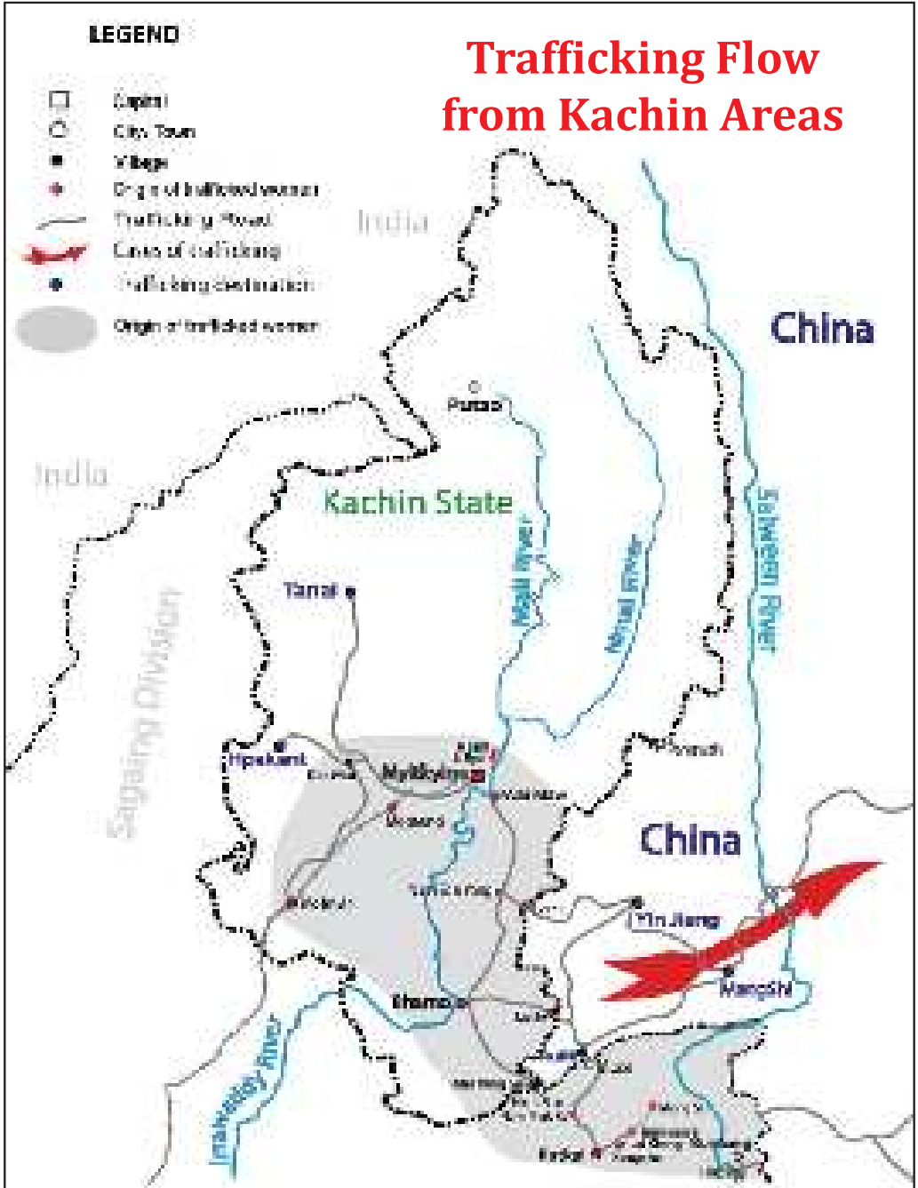
Map from KWAT report Driven Away (2005)

မကြာသေးမီက ကျေးရွာသူ၊ ရွာသားများ ပြောင်းရွှေ့ခံခဲ့ရသော နေရာဒေသများသည် လွန်ခဲ့သော ၁၀ ခန့်ကာလအတွင်း လူကုန်ကူးမှုနှုန်း မြင့်မားသော နေရာများအဖြစ် KWAT မှ မှတ်တမ်းတင်ပြုစုခဲ့သော နေရာများဖြစ်သည်။ (မြေပုံ များ၌ကြည့်ပါ) လူကုန်ကူးခံရသည့် အမျိုးသမီးများ၏ ကျေးရွာများသည်လည်း ထိုအမျိုးသမီးများနည်းတူ ယခုအခါ တရုတ်နယ်စပ်သို့ ပြောင်းရွှေ့ခံခဲ့ရသည်။ အမျိုးသမီးများသည် နိုင်ငံတံခါးပြင်ပသို့ နည်းအမျိုးမျိုးဖြင့် ရောက်ရှိခဲ့ကြသည်။ ၎င်းတို့ရင်ဆိုင်နေရသည့် ကြောက်မက်ဖွယ်ရာ ဘဝအခြေအနေနှင့် နိုင်ငံတကာအသိုင်းအဝိုင်းမှ ထိုအကြပ်အတည်းများကို ကိုင်တွယ်ဖြေရှင်းနိုင်ခြင်းမရှိခဲ့ခြင်းသည် နယ်စပ်ဖြတ်ကျော်၍ လူကုန်ကူးမှု အဖြစ်များသော နေရာများသို့ ရောက်ရှိရန် အမျိုးသမီးများအား တွန်းအားပေးနေသည်။ ထိုဒေသများတွင် လူကုန်ကူးသည့်ကွန်ယက်များ များစွာရှိပြီး အမျိုးသမီးများ၏ တရားဝင်လက်မှတ်မရှိခြင်းနှင့် ဘဝရှင်သန်ရေးအတွက် ခက်ခဲနေခြင်းကို အခွင့်ကောင်းယူ၍ လူကုန် ကူးရန် အဆင်သင့်ရှိနေကြသည်။