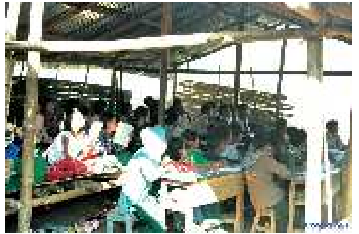
Close quarters: IDP children gather for their studies

အိုးအိမ်မဲ့ဒုက္ခသည်များ၏ ခန့်မှန်းချေ ၄၅ ရာခိုင်နှုန်းမှာ အသက် ၁၆ နှစ်အရွယ်နှင့် ၁၆ နှစ်အောက် ကလေးများဖြစ်ကြပြီး ၎င်းတို့ နေထိုင်ရာ ကျေးရွာရှိ ကျောင်းများမှ စွန့်ခွာခဲ့ရသည်။ ကြီးမားသည့် ဒုက္ခသည်စခန်းအများစုတွင် ကျင့်အာဏာပိုင်များမှ ကလေးများ အတွက် ကျောင်းဆောင်အသစ်များ ဆောက်လုပ်ပေးသော်လည်း ဆရာ၊ ဆရာမများနှင့် ကျောင်းသုံးပစ္စည်းများ မလုံလောက်ခြင်းမ ရှိသည့်အပြင် စာသင်ခန်းများမှာလည်း လုံလောက်သည့် အကျယ် အဝန်းမရှိပေ။