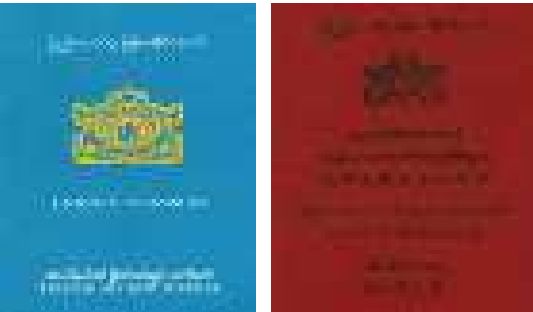
ဖြတ်ကျော်ရန်ခက်ခဲခြင်း: ဒုက္ခသည်များအတွက် တရားဝင် နယ်စပ်ဖြတ်ကျော်ခွင့်လက်မှတ် ကိုင် ဆောင်နိုင်ရေးမှာ ဖြစ်နိုင်ချေမရှိသလောက် ပင်ဖြစ်သည်။

မြန်မာနိုင်ငံသားများအနေဖြင့် တရုတ်နိုင်ငံတွင်းသို့ တရားဝင် ခရီး သွားလာရန် ပထမဦးစွာ မြန်မာနိုင်ငံလူဝင်မှုကြီးကြပ်ရေးရုံးမှ တရားဝင်ထုတ်ပေးသည့် နယ်စပ်ဖြတ်ကျော်ခွင့်ရှိရမည်ဖြစ်သည်။ နယ်စပ်ဖြတ်ကျော်ခွင့်ရှိသည့် အထောက်အထား နှစ်မျိုးရှိသည်။ ပထမတစ်မျိုးမှာ တရုတ်နိုင်ငံ တွင်းတပတ်ကြာခရီးသွားလာခွင့်ရှိသည့်အစီမံခန့်ခွဲရေးဦးစီးဌာနမှ ထုတ်ပြန်ပြီးဒုတိယ တစ်မျိုးမှာ တနင်္သာရီတိုင်းဒေသကြီး၊ တရုတ်နိုင်ငံတွင်း နေထိုင်ခွင့်လျှောက်ထားနိုင်သည့် အနီရောင်စာအုပ်ဖြစ်သည်။ တရုတ်နိုင်ငံတွင်း ကြာကြာနေခွင့်ရှိ သည့် အနီရောင် နယ်စပ်ဖြတ်ကျော်ခွင့်စာအုပ်ရရှိရန် ကန့်သတ်မှု များစွာရှိသော်လည်း အထောက်အထားနှစ်မျိုးစလုံးသည် ကချင် ပြည်နယ်မှ ရွှေ့ပြောင်းအလုပ်သမား များအတွက် ဥပဒေအရ တစုံတရာ ကာကွယ်မှုပေးနိုင်သည်။