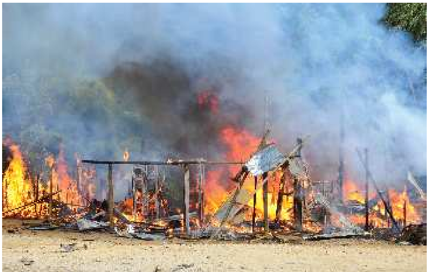
Burma Army air strike: A house in Kachin State burns after being hit by a bomb dropped by Burmese Army forces.