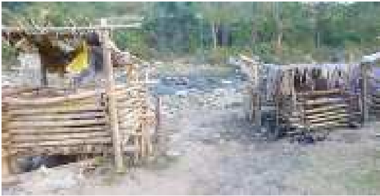
A stone's throw away: ဒုက္ခသည်စခန်းမှ တရုတ်ပြည်သို့ ဖြတ်ကျော်သည့် ခိုးကူးလမ်း

ကချင်ထိန်းချုပ်သည့်နယ်မြေအတွင်းရှိ အိုးအိမ်မဲ့ ဒုက္ခသည် အများစုသည် တရုတ်နယ်စပ်တဖက် ကမ်းရှိ ဒုက္ခသည်စခန်း များတွင် ခိုလှုံနေကြသည်။ ၎င်းတို့မူရင်းနေထိုင်ရာကျေးရွာမ ပြားမှ နယ်စပ်သို့ ကားဖြင့်လာလျှင် တစ်ရက် (သို့) တစ်ရက်ထက် ကျော်၍ သွားရသော်လည်း ယခု ဒုက္ခသည်စခန်း မှ လမ်းခဏလျှောက်ရုံဖြင့်ပင် တရုတ်နိုင်ငံတွင်း သို့ သွားနိုင်သည်။ တရုတ်နိုင်ငံသို့ ဖြတ်ကျော် သွားလာခြင်းသည် အလွန်ပင် လွယ်ကူလှသည်။