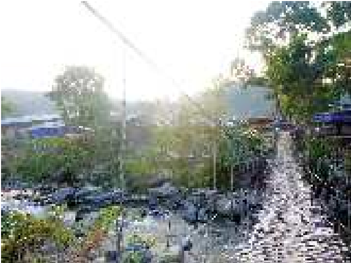
The way across: A wooden bridge links a camp to China

ဒုက္ခသည်များသည် ၎င်းတို့အိမ်ယာမှ ထွက်ပြေးစွန့်ခွာလာပြီး သည့်နောက် အများစုမှာ ၎င်းတို့၏ မိသားစုဝင်များနှင့် ကွဲကွာနေရမည့် အခြေအနေနှင့်ရင်ဆိုင်ကြရသည်။ အခြေအနေအရ မိသားစုဝင် တချို့မှာ ဒုက္ခသည်စခန်းများအတွင်း နေထိုင်ရသကဲ့သို့ အချို့မှာ အခြားခေတ္တမျိုးသားချင်းနှင့်အတူ နေထိုင်ကြရပြီး အချို့မှာလည်း အလုပ်အကိုင်ရှာဖွေရန် အတွက် အခြားနေရာဒေသများသို့ သွားရောက်ကြရသည်။ ဒုက္ခသည်စခန်းမှ မိဘအချို့သည် ၎င်းတို့အိမ်တွင် ကျန်ခဲ့သော ပစ္စည်းများ သွားရောက်ယူရန်အတွက် ၎င်းတို့၏သားသမီးများကို စခန်းအတွင်း ခဏတာ ချန်ထားကြရသည်။ ဤအခြေအနေအောက်တွင် အိမ်တွင်ကျန်ရစ်ခဲ့သည် ကလေးများအား တရုတ်နိုင်ငံသို့ သွားရောက်ရန် ပွဲစား များမှ ဖြားယောင်းသွေးဆောင်ရန် အခွင့်သာစေသည်။