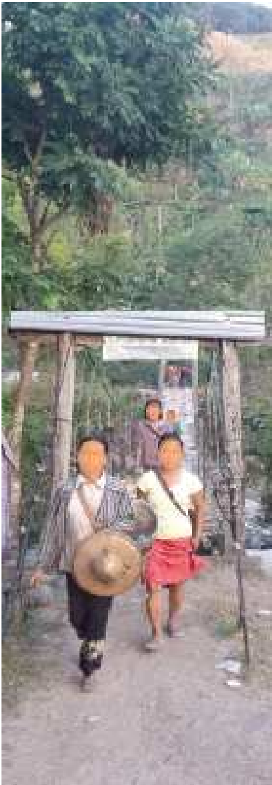
အလယ်၌ ပိတ်မိနေခြင်း - ကချင် စစ်ပြေးဒုက္ခသည်စခန်းနှင့် တရုတ်နိုင်ငံကို ဆက်သွယ်ထားသော တံတားကို ဖြတ်ကူးနေစဉ်။