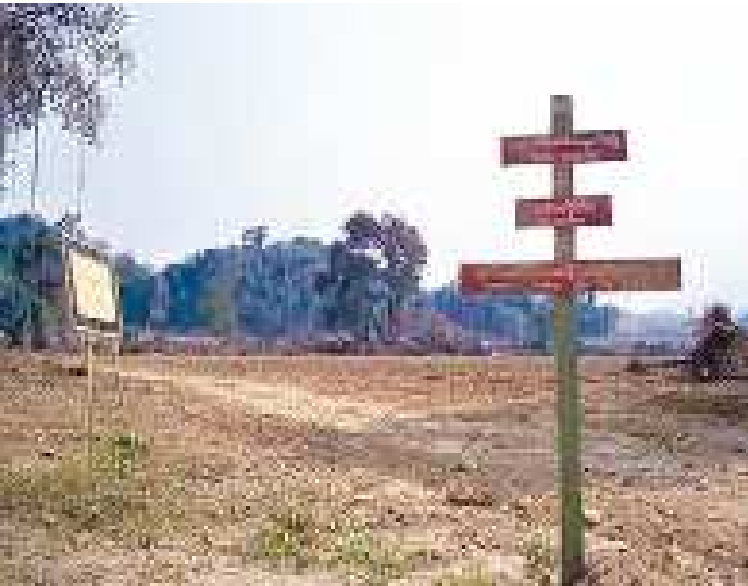
Clear-cut destruction: Lands in the Hukawng Tiger Reserve in Kachin State, including small local farms, were confiscated and razed to make room for commercial sugarcane, tapioca, and jatropha plantations.

ကချင်ပြည်နယ်အတွင်း ပဋိပက္ခများ ပြန်လည်ဖြစ်ပွားမီ အချိန်ကတည်းကပင် လူကုန်ကူးမှုပြဿနာသည် စိုးရိမ်ဖွယ် ပြဿနာတစ်ရပ်ဖြစ်ခဲ့သည်။ ဖိနှိပ်ချုပ်ချယ်သော နိုင်ငံတော် မူဝါဒများကြောင့် ပြည်သူအများစုမှာ ဆင်းရဲတွင်းနက်ခဲ့ကြ ရသည်။ ကြီးမားသည့် သဘာဝသယံဇာတထုတ်ယူမှု စီမံ ကိန်းများ၊ အထူးသဖြင့် စစ်တပ်နှင့်အစိုးရခရီးစဉ်များ ပူးပေါင်း လုပ်ဆောင်သည့် ကြီးမားသည့်စိုက်ပျိုးရေးလုပ်ငန်းများ၊ ကြီးမားသည့် ဆည်တည်ဆောက်မှု စီမံကိန်းများနှင့် သတ္တု တူးဖော်ရေးလုပ်ငန်းများကြောင့် ဒေသခံပြည်သူများသည် ၎င်းတို့နေထိုင်ရာ နယ်မြေမှ အဓမ္မပြောင်းရွှေ့ခံကြရပြီး ၎င်းတို့၏ အသက်မွေးဝမ်းကျောင်းမှုလုပ်ငန်းများလည်း ဖျက်ဆီးခံခဲ့ရသည်။ ထိုစီမံကိန်းများမှ ရရှိသည့် တိုင်းပြည် ဘဏ္ဍာငွေများကိုလည်း ပြည်သူများ၏ ကျန်းမာရေး၊ ပညာရေးအတွက် အသုံးမပြုပဲ စစ်တပ်အသုံးစရိတ်အတွက်သာ အဓိက အသုံးပြုခဲ့သည်။ ဤကဲ့သို့ ဆိုးဝါးလှသည့် စီးပွားရေးဆိုင်ရာ စီမံခန့်ခွဲမှုညံ့ဖျင်းမှုကြောင့် နိုင်ငံတွင်း ငွေကြေးဖောင်းပွမှုနှင့် အလုပ်လက်မဲ့နှုန်း မြင့်မားမှုကို ဖြစ်စေခဲ့သည်။ အလုပ်မဲ့ခြင်း၊ မြေယာမဲ့ခြင်းနှင့် ကုန်ဈေးနှုန်း အဆမတန် ကြီးမားခြင်းကြောင့် ပြည်သူများသည် တရုတ်နိုင်ငံသို့ အလုပ်အကိုင်ရှာဖွေရန်အတွက် ရွှေ့ပြောင်းခဲ့ကြသည်။