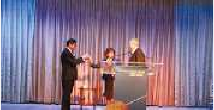
Pursuing peace? ၂၀၁၃ ခုနှစ် ဧပြီလတွင် ဝန်ကြီး ဦးအောင်မင်းသည် သမ္မတဦးသိန်းစိန်ကိုယ်စား International Crisis Group မှ ငြိမ်းချမ်းရေးဆုကို လက်ခံရယူနေချိန်တွင် (အောက်ပုံ) ကချင်ပြည် နယ်တွင် မြန်မာအစိုးရ စစ်သားများ တိုးမြှင့်ချထား ခဲ့သည်။ (အထက်ပုံ)