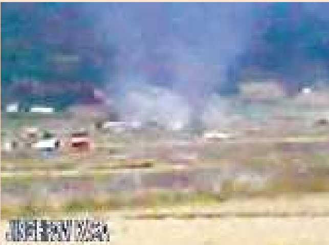
Nowhere to go: ဦးဒီယိုမှတ်တမ်းထဲတွင် ဖိုင်ကောင်းဒုက္ခသည် စခန်း မီးလောင်ကျွမ်းနေပုံ။

မြန်မာအစိုးရစစ်တပ်များ၏ ကျူးကျော်တိုက်ခိုက်မှုအန္တရာယ်မှ လွတ်မြောက်ရန်အတွက် တရုတ်နယ်စပ်သို့ ထွက်ပြေး တိမ်းရှောင်ခဲ့ကြသော ရွာသူ၊ ရွာသား ၃၀၀ ကျော်သည် တရားဝင်နေထိုင်ခွင့်လက်မှတ်နှင့် တရားဝင်ကာကွယ် စောင့်ရှောက်မှု မရရှိကြပဲ လူကုန်ကူးမှု၊ ခေါင်းပုံဖြတ်မှု အန္တရာယ်ကို ဆိုးဝါးစွာ ရင်ဆိုင်နေကြရသည်။