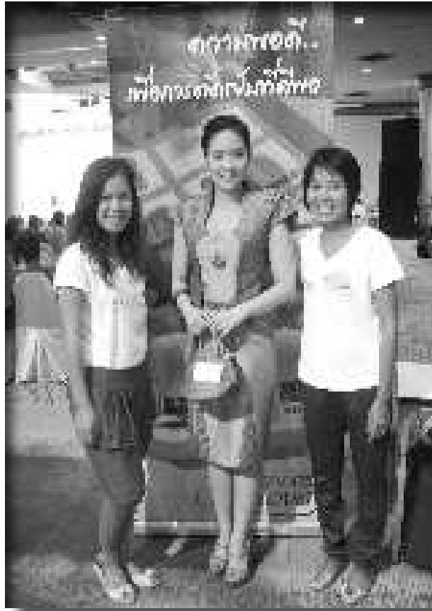
shingjawng poi shanglawm ai manang ni hte rau

Myit ma myit dik ai. Raitim Myen Mung Jinghpaw myu masha langai hku na lu shingjawng na kum hpa lu ai rai yang ndai hta grau na myit dik na re. Du wa na shaning hta Myen Mungdan jinghpaw masha langai hku na lu shingjawng na re ngu myit mada ai .